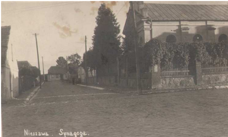
Nieszawska synagoga, fotografia z okresu międzywojennego.